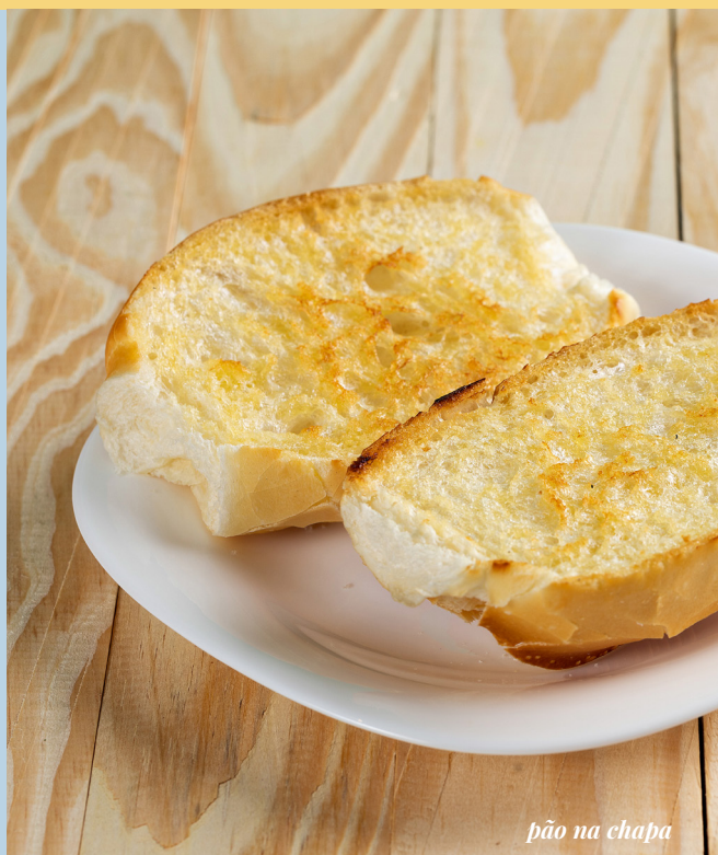
pão na chapa