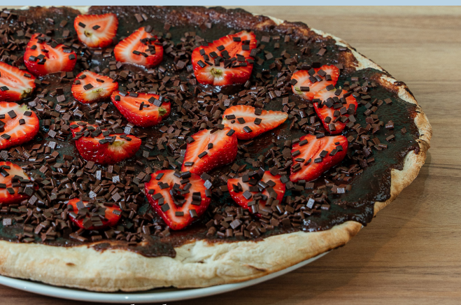
morango com chocolate

Adicional de sorvete de creme (8 bolas) +R$ 8,00