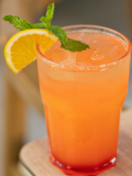
sex on the beach