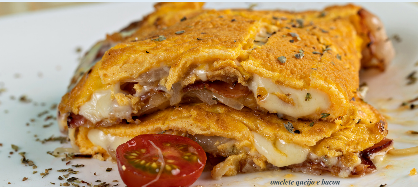
omelete queijo e bacon