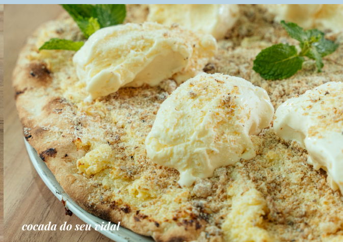
cocada do seu vidal