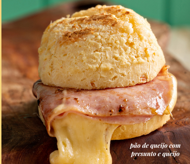
pão de queijo com presunto e queijo