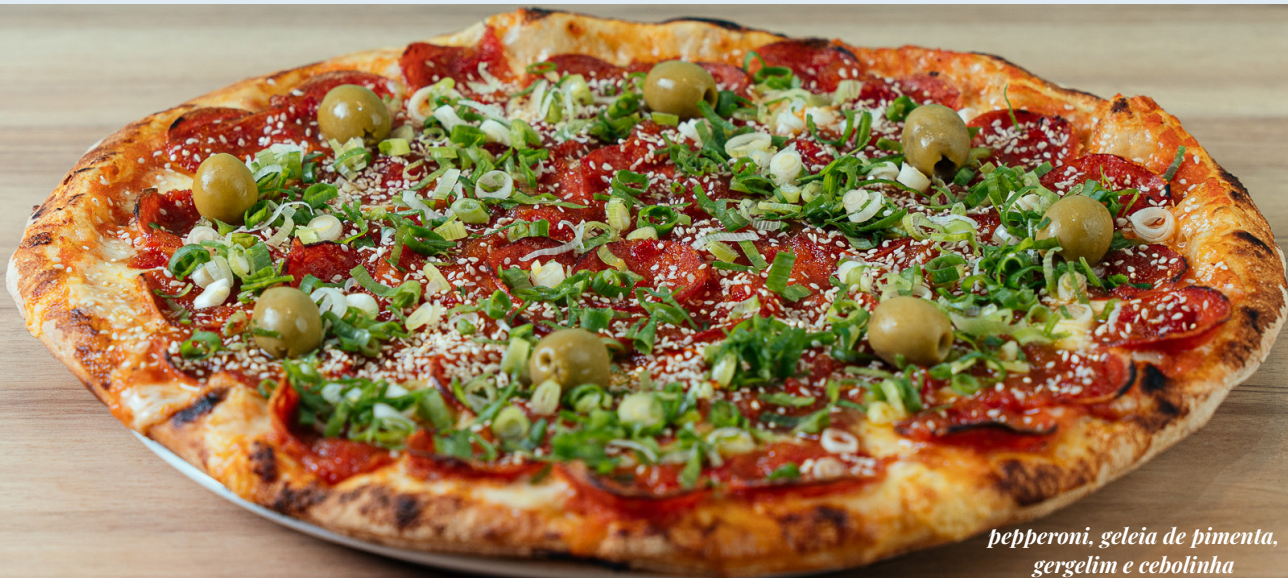
peperoni, geleia de pimenta, gergelim e cebolinha